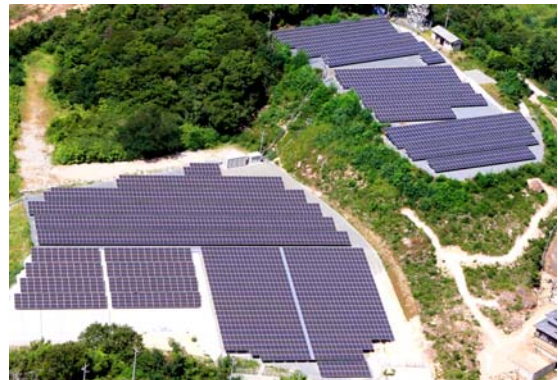
今回のメガソーラー設備の航空写真