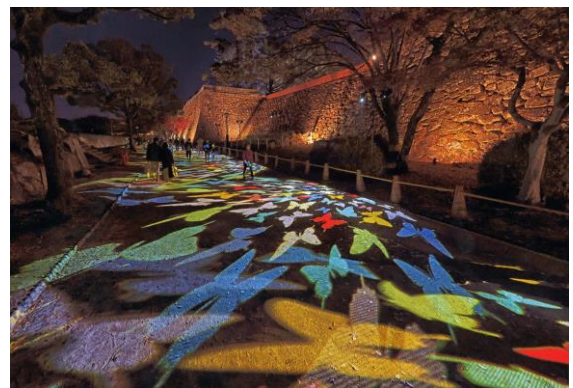
準グランプリ『乱舞する蝶の道』最相 政実 様